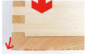
底板の膨張により隙間ができます